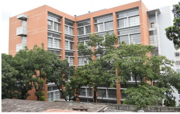
ইনস্টিটিউট অব বায়োটেকনোলজি স্টাডিজ এন্ড ফার্মাসিউটিক্যাল সাইন্সেস ভবন

➤ ১০.২ প্রকল্পের নাম: বিসিএসআইআর ঢাকা ও চট্টগ্রাম কেন্দ্রে নিরাপদ ও স্বাস্থ্যকর শূটকী মাছ প্রক্রিয়াকরণ এবং ইনডোর ফার্মিং গবেষণা সংক্রান্ত সুবিধাদি স্থাপন।