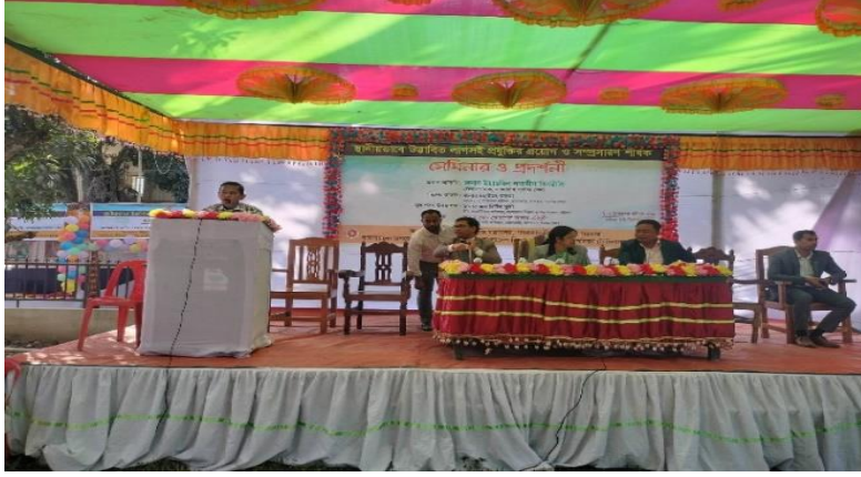
রাইয়ংছড়ি, বান্দরবন-এ লাগসই প্রযুক্তি প্রদর্শন ও সেমিনারে অংশগ্রহণ।